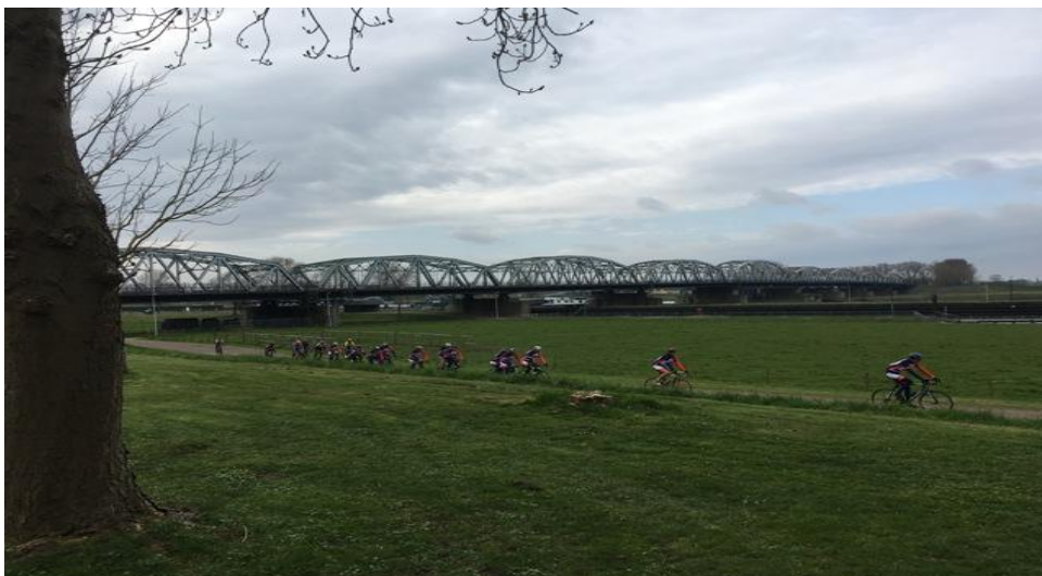
De A groep jagend over dijk en weer bijna terug in Brabant