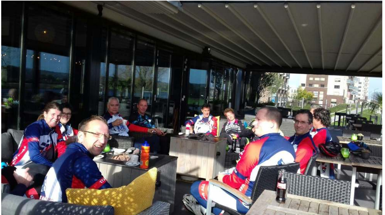
Ergens op een zondagochtend koffiepauzemet de B groep