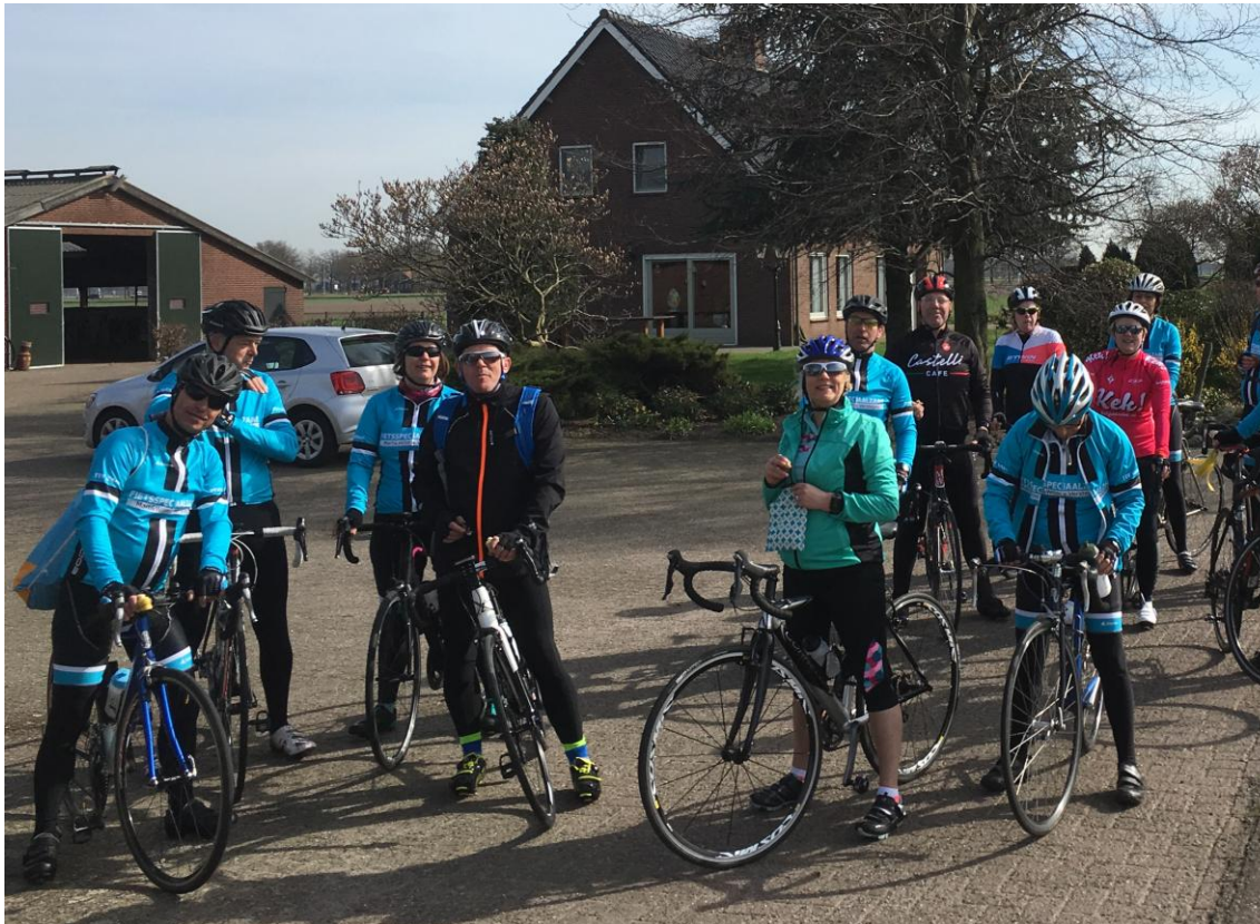
Start to Cycle 2018

Opgeven bij Herman Vissers familievissers@home.nl